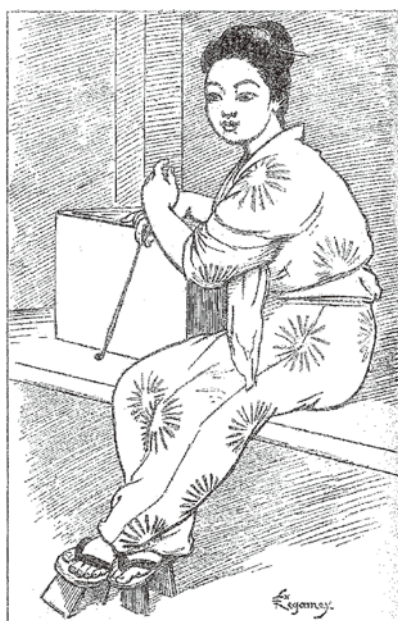
屋食の給仕をする若い娘