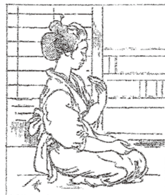
ジャムつきのパンを見つめる女中