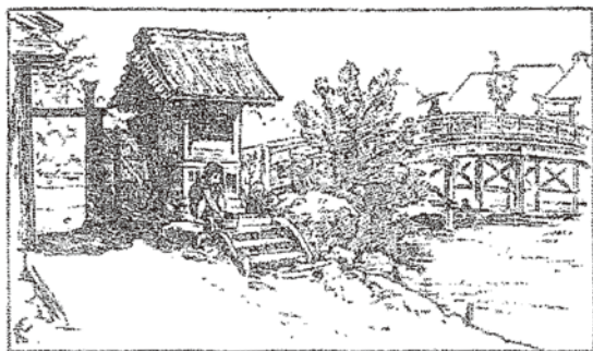
お堂の階段で米を研ぐ女中