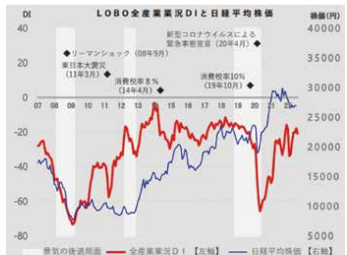
※DI = (増加・好転などの回答割合) - (減少・悪化などの回答割合) ※業況 採算 : (好転) - (悪化) ※売上 : (増加) - (減少)

先行き見通しDIは、▲26.6(今月比▲5.6ポイント)。今後も感染拡大が継続し、従業員の感染による生産や取引などへの影響を懸念する声が業種を問わず聞かれた。特に、サービス業や小売業では、消費者の外出控えによる需要減を危惧する事業者が増加している。資源・資材価格の高騰が長期化し、コスト増加分の十分な価格転嫁が追い付かず、収益確保も難しい中、感染の沈静化を見通せず中小企業の先行きは厳しい見方となった。